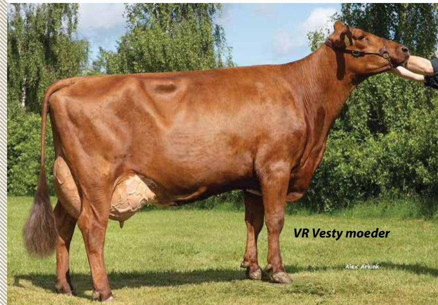
VR Vesty moeder