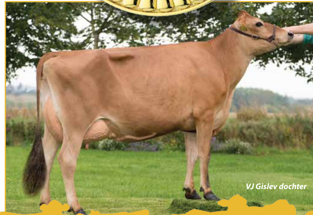
VJ Gislev dochter