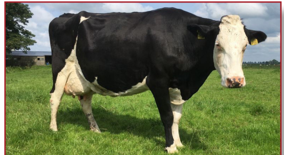
Klaaske 477 ProCROSS G1 (50% Montbéliarde - 50% Holstein)

Van de Montbéliarde fokstier Helux worden 7 dochters gemolken. De gemiddelde LW is 116. Helux dochter Klaaske 477 is drachtig van de VikingRED stier VR Viljar. Inmiddels is de cirkel rond en worden de eerste G3 ProCROSS koeien gemolken die weer een Holstein stier als vader hebben.