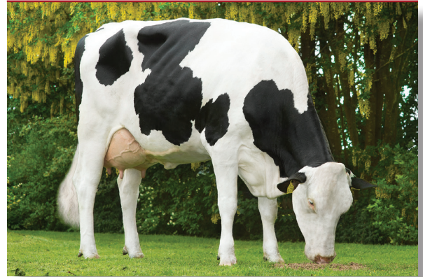
Crasat dochter 50%MB-50%HF